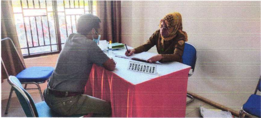
Pengaduan secara Langsung